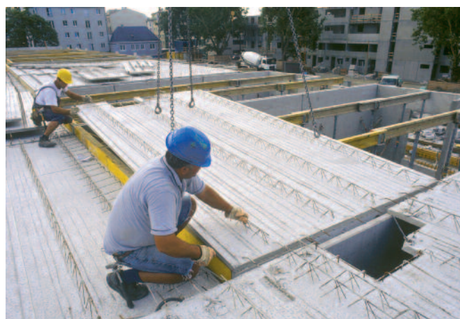
Bild 9: Mindestauflagertiefe: empfohlen 5 cm, sonst Randunterstellung