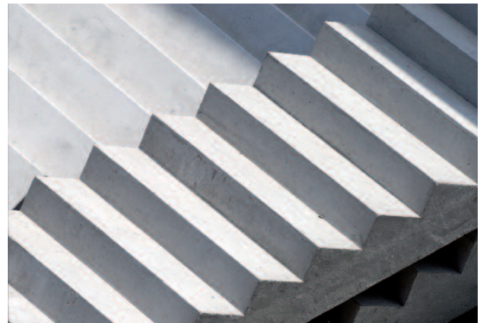
Bild 2: Gerade Beton-Fertigteiltreppe